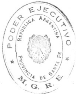
HERMES JUAN BINNER GOBERNADOR DE SANTA FE